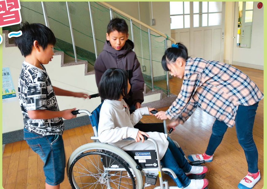
車椅子体験（宮田北小学校）