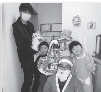
脇野自治会 クリスマス会