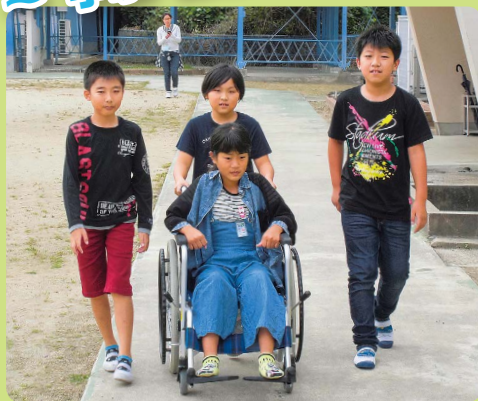
車椅子体験（宮田小学校）