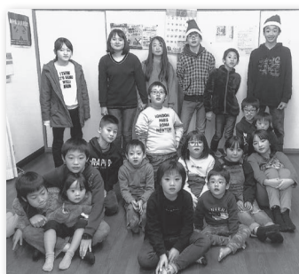
太蔵東区自治会 クリスマス会