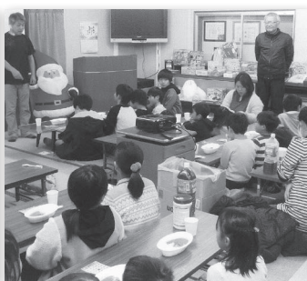
原町・杉坂自治会 クリスマス会