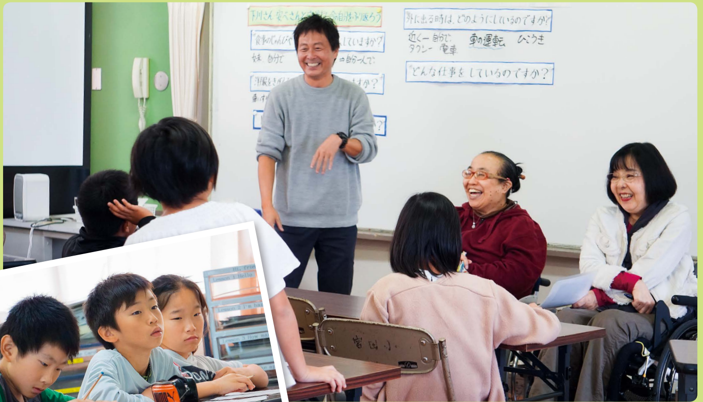
車椅子を使って生活されている方との交流会（宮田小学校）