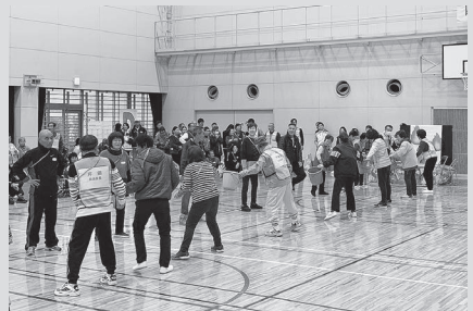
▲バケツリレー競争