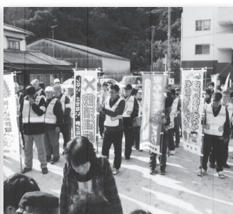
百合野団地自治会 歳末安心安全パトロール

問い合わせ先 宮若市社会福祉協議会 TEL 0949-32-0335 FAX 0949-32-1009