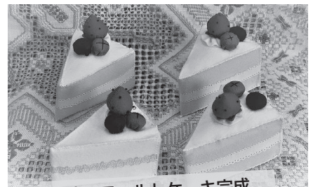
苺のフェルトケーキ完成

目から鱗なコツやテクニックを教えてください、根気よく一つ一つのパーツを作り上げていきました。参加者の方からは、完成した時の達成感とケーキが可愛くできたと喜びの声が上がりました。今回は、トヨタ自動車九州㈱の皆さんがボランティアでフェルトケーキのキット作りに参加していただきました。これからも、子育て支援にご協力をよろしくお願い致します。ありがとうございました。